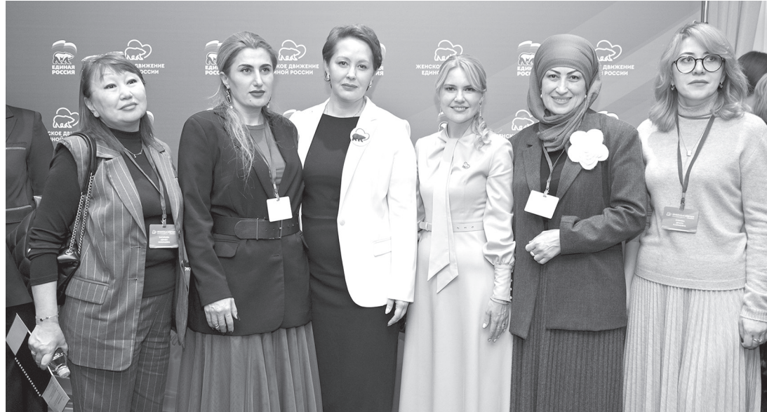
Участницы форума, в числе которых и представительницы Карачаево-Черкесии