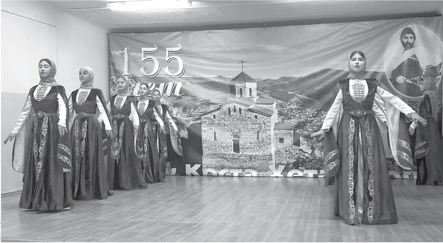
Выступает девичий ансамбль Каменномоетского СДК «Чолпан»

Коста Хетагуров умер в отцовском доме в селе Георгиевско-Осетинском 19 марта 1906 года, и проститься с ним прибыли представители всех народов — карачаевцы, русские, черкесы, ногайцы, абазыны. Через несколько дней после похорон прибывшая сюда из Осетии делегация, выполняя волю своего народа, перевезла его прах во Владикавказ. После отпевания в церкви мусульмане на улице сделали дуа. За покой его души молился весь Кавказ.