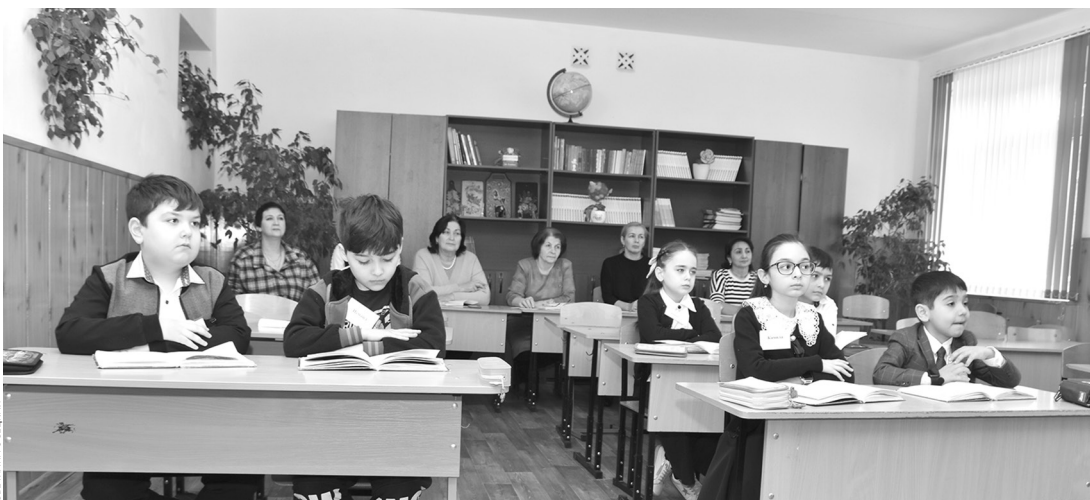
В современной школе необходимо создать условия для развития талантов