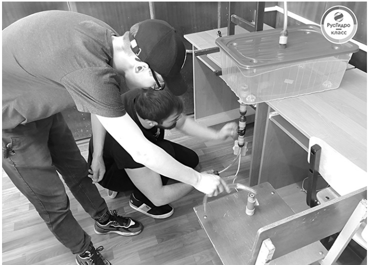
Ребята знакомятся с работой гидроэнергетики

Проект РусГидро-класс (прежнее название «Энергокласс ПАО «РусГидро») — один из механизмов реализации масштабной программы опережающего развития кадрового потенциала «От Новой школы к рабочему месту». Проект реализуется в формате дополнительных занятий во внеурочное время и на-